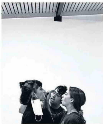
La confusión, el olvido y la rabia son puestos en escena de una manera simbólica.

-En este caso, a partir de un sentir inspirado en un lenguaje filmico, se plantean distintos escenarios que son parte del montaje y que, además, sirven de conectores narrativos en la experiencia del escenario. De este modo, la sensibilidad y la emotividad resultan clave al momento de plasmar, memorias, recuerdos, texturas y realidades.