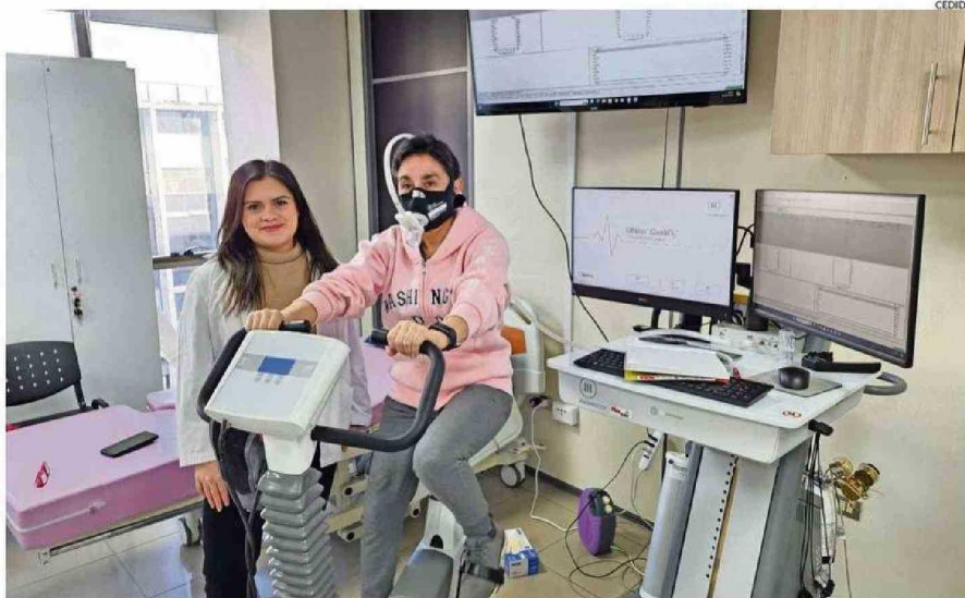
Las participantes realizan una serie de rutinas, entre ellas de tipo interválico de intensidad vigorosa en una bicicleta estática.

Tanto este tipo de cáncer como otras patologías cardiovasculares se agravan por el sedentarismo, que es la falta de actividad física y un estilo de vida inactivo. Esto es, detalla Álvarez, en no practicar actividad física de baja a moderada intensidad de 150 a 300 minutos duran-