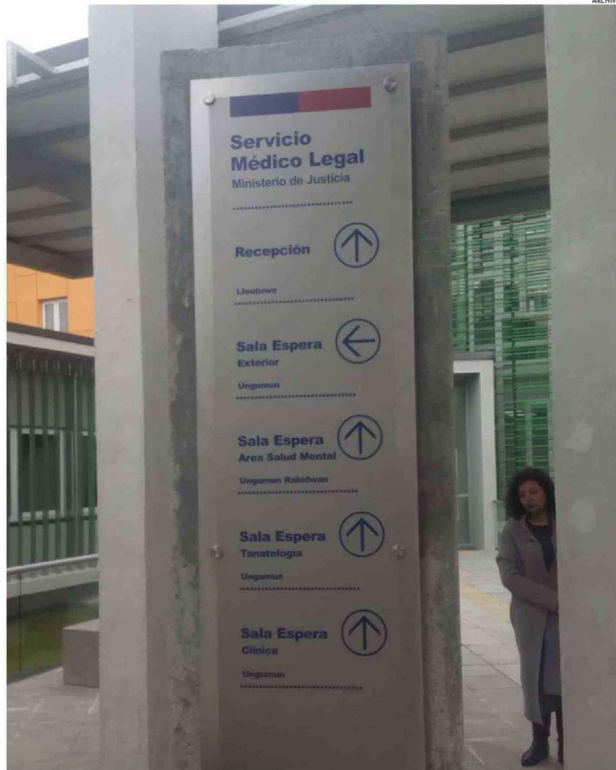
A CONTAR DE LA PRÓXIMA SEMANA EL SML PODRÁ CONTAR CON UN MAYOR NÚMERO DE HORAS PARA LOS PERITAJES.

Por lo anterior, sostiene que como Fiscalía Regional, desde hace un tiempo,