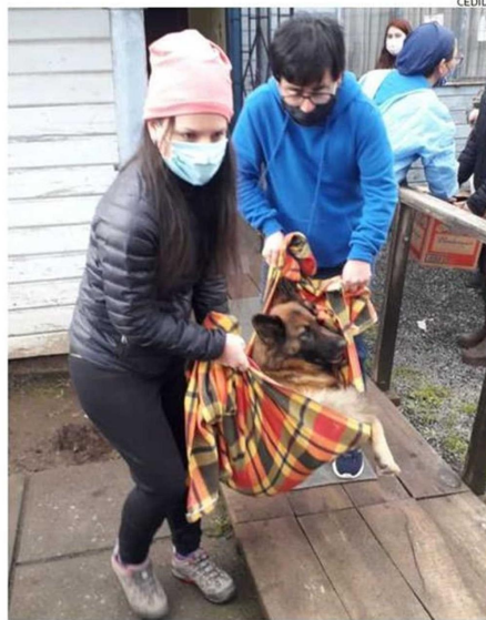
SE HACEN OPERATIVOS DE ESTERILIZACIÓN, PERO NO SON SUFICIENTES.

de perros y gatos ha logrado concretar el municipio en la comuna de Osorno, desde el 2010 a la fecha, gracias a un programa que fue pionero a nivel nacional.