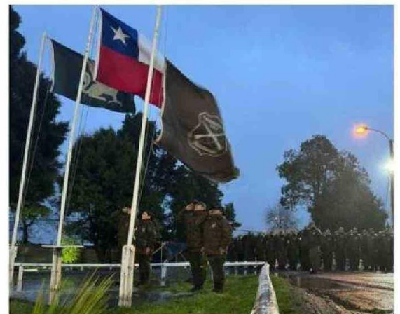
A PRIMERA HORA PARTIERON LOS HOMENAJES.