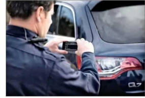
Aunque no está en Chile, existe una aplicación del celular que permite enviar inmediatamente una imagen a la nube para que no sea alterada y sirva de evidencia.

Las cámaras corporales o bodycams (al centro del cuerpo) como las que adquirió Carabineros, guardan el video internamente y encriptan los datos. Luego son almacenados en la nube para evitar su manipulación.