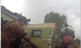
deliberadamente— acontecimientos importantes. "Se puede configurar para que la cámara grabe cuando se enciende la sirena del auto, pero también para que lo haga cuando el funcionario desenfunda el arma. Esto último no solo enciende la cámara de ese funcionario, sino de todos los que están a su alrededor", aclara del