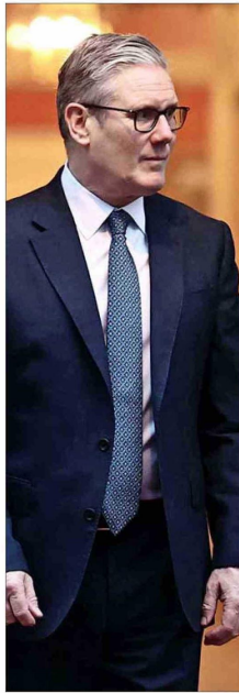
KEIR STARMER, Primer Ministro británico.