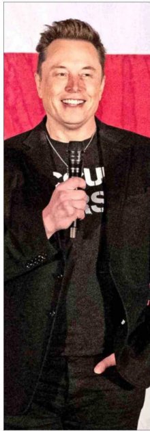
ELON MUSK, dueño de Tesla y SpaceX, entre otras empresas