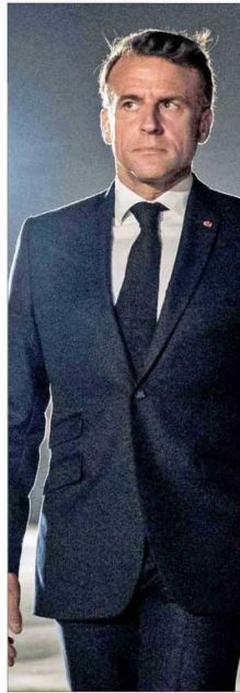
EL PRESIDENTE FRANCÉS, Emmanuel Macron.