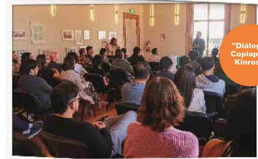
“Diálogos Copiapó” Kinross.

Dentro del plan de actividades, durante este mes y noviembre se realizarán cuatro conversatorios en conjunto con la Universidad de Atacama, el Instituto Santo Tomás, Inacap e Iplacex. En el primer ciclo se abordará la temática del “Empleo y Acceso a Educación Superior”.