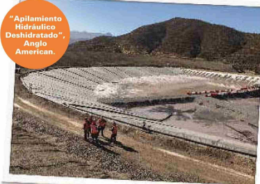
“Apilamiento Hidráulico Deshidratado”, Anglo American.

Adicionalmente, Codelco busca aportar al desarrollo de capital humano con el programa “Piensa Minería”, que entrega financiamiento a estudiantes de doctorado en temas de interés para su operación. Desde 2016, este plan ha beneficiado a 46 alumnos, con una inversión acumulada cercana a US$ 2 millones.