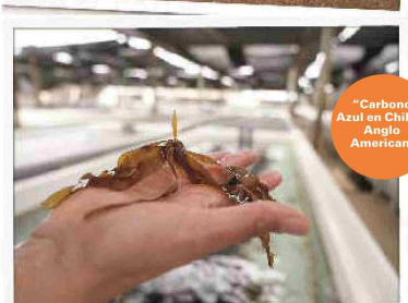
“Carbono Azul en Chile”, Anglo American.

Asimismo, trabajaron con académicos de la UTFSM para la validación experimental del proyecto de Apilamiento Hidráulico Deshidratado (HDS, por su sigla en inglés); y en conjunto con la UCV desarrollaron el proyecto “Habilitación de Espacio Público Villa El Sol”, construido con escorias de cobre, en Cate-mu, Valparaíso.