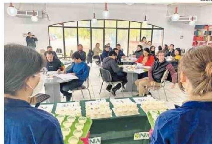
UNA VEINTENA DE PERSONAS PROBARON LA LECHE Y SUS EFECTOS.

Según datos entregados por el Ministerio de Salud (Minsal) en 2022, el 50% de la población chilena es in-