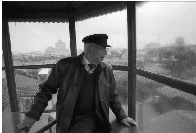
Este retrato de Gonzalo Rojas forma parte de la muestra. Es un proyecto en el que participan, entre otros, la Vicerrectoría de Comunicaciones, el Instituto VioDemos y la Escuela de Psicología UC.