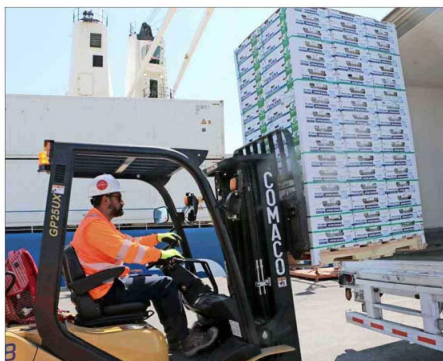
En 2024, las exportaciones lograron el récord de superar por primera vez los US$ 100.000 millones, principalmente por la venta de cobre y de frutas.

En 2024, los envíos a este grupo de naciones crecieron un 10% y sumaron US$ 14.133 millones, por encima de la Unión Europea y el Mercosur. El ingreso de Reino Unido abre nuevas opciones para 2025, dicen expertos.