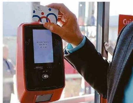
PAGO PUEDE SER EFECTIVO O UTILIZANDO LA TARJETA CONECTA.