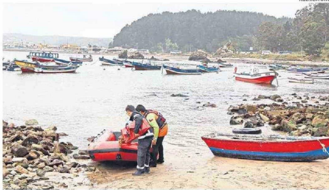
POR MAR Y TIERRA SE REALIZAN LAS LABORES DE BÚSQUEDA DEL VETERINARIO DE 26 AÑOS DE EDAD.

Autoridad marítima afirmó que quienes realizan algún deporte deben dar aviso sobre el inicio y fin de cada actividad, y contar con los elementos de seguridad.