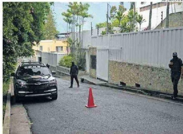
POLICÍAS AFUERA DE LA EMBAJADA DE ARGENTINA EN CARACAS.