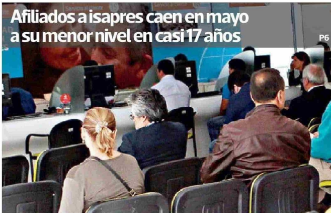
Afiliados a isapres caen en mayo a su menor nivel en casi 17 años