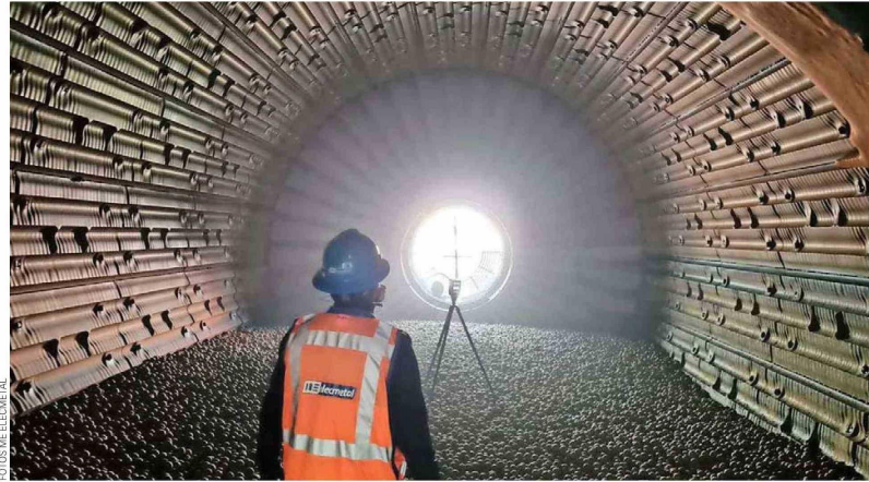
Entre la oferta de productos y servicios que ME Elecmetal posee destacan las bolas de acero para la molienda.

En la búsqueda por entregar siempre las mejores soluciones a sus clientes, la empresa incluye dentro de sus servicios integrales de chancado el suministro de repuestos para equipos de trituración, ofreciendo una amplia gama para trituradoras de cono, giratorias y mandíbulas. Esto posibilita a sus clientes acceder a repuestos de alta calidad para todas las máquinas de trituración del mercado de minería, desarrollados con ingeniería propia y diseñados bajo los estándares y certificaciones exigidas por los fabricantes de equipos,