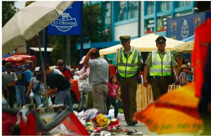
Un video se reenvió en miles de oportunidades por Chillán, denunciando una pelea entre cuidadores de autos en el Persa.

Las quejas y solicitudes por soluciones se han hecho constantes en las oficinas del Concejo Municipal, por