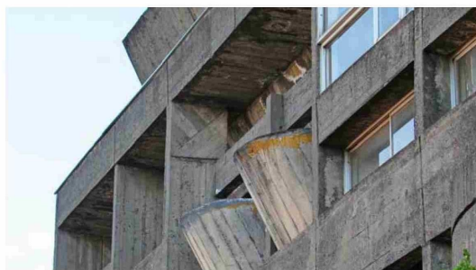
LA FACHADA DEL EDIFICIO de la Cooperativa Eléctrica de Chillán, construido entre 1962 y 1965.