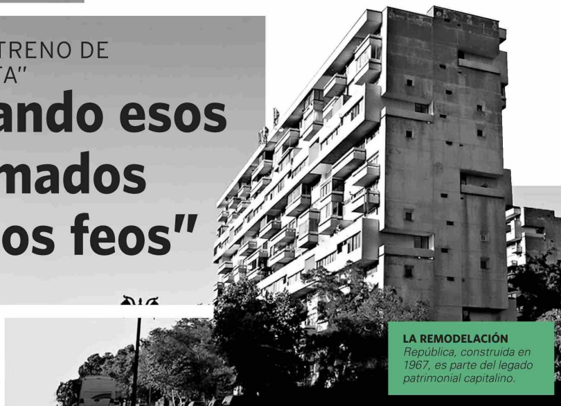
LA REMODELACIÓN República, construida en 1967, es parte del legado patrimonial capitalino.