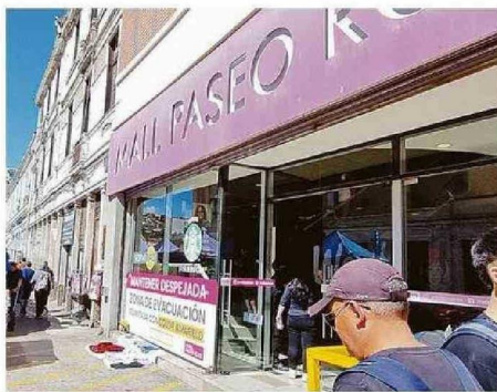
6 DE CADA 10 LOCALES ENTREVISTADOS FUERON VÍCTIMA DE ALGÚN DELITO EL PRIMER SEMESTRE DE 2024.

Pakomio indicó que uno de los hallazgos más alarmantes es el desplazamiento de la confianza, "la que transita desde una que se depositaba en las autoridades como garantes de la seguridad hacia una que se desarrolla entre pares, es decir, los ciudadanos ven más efectividad en aquellas medidas que coordinadamente realizan entre vecinos o loca-