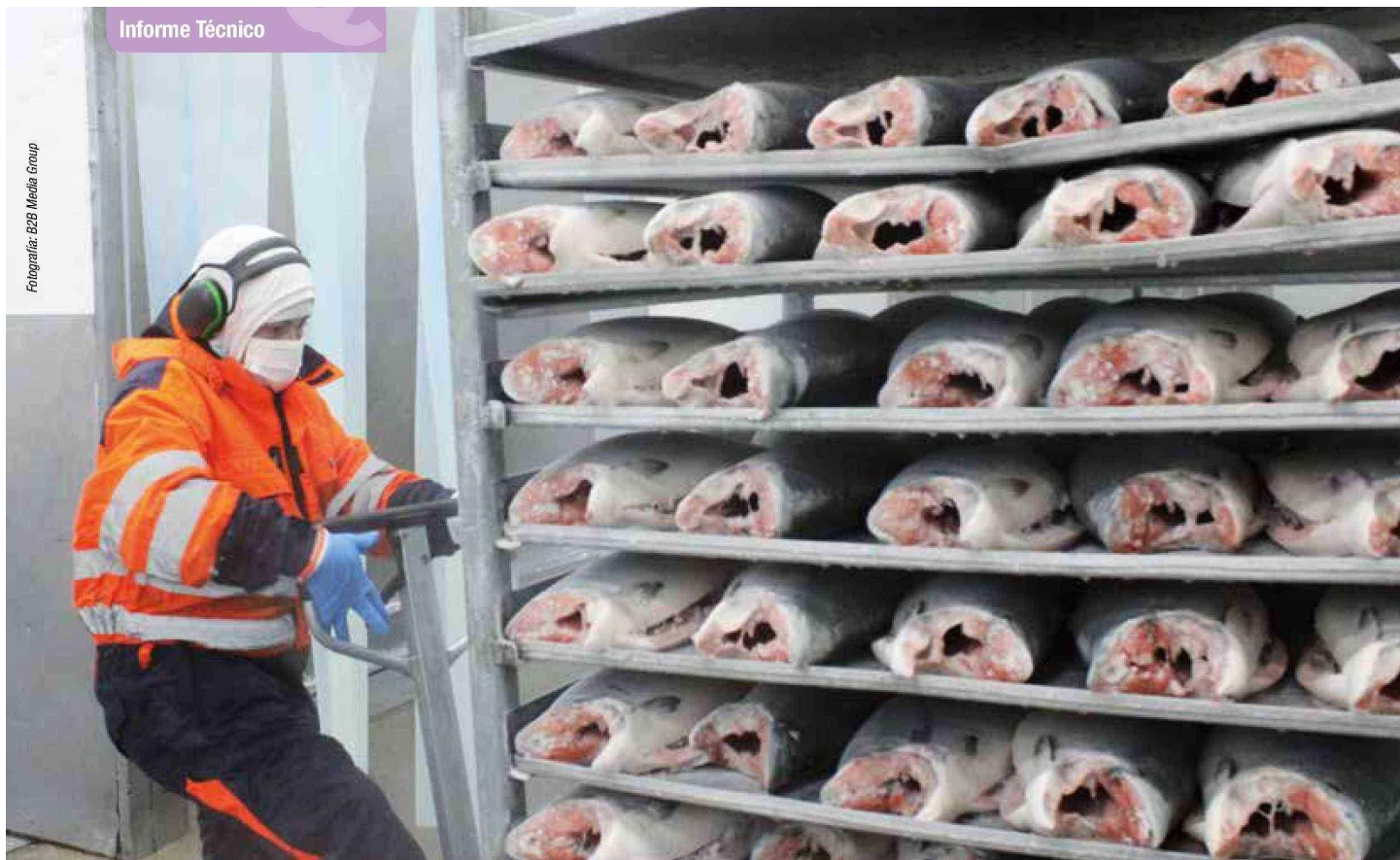
Procesamiento de salmones en planta de procesos.