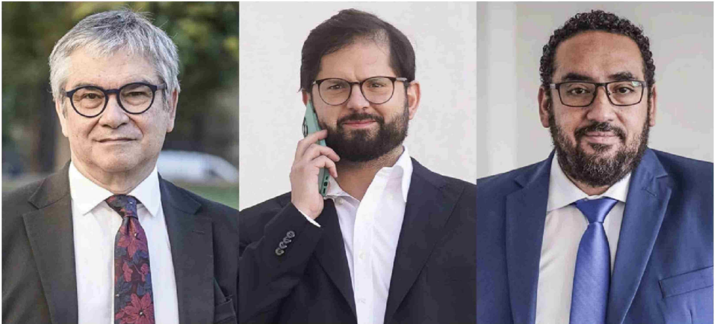
► El ministro de Hacienda, Mario Marcel; Gabriel Boric, Presidente de Chile; y Nicolás Cataldo, titular de Educación.