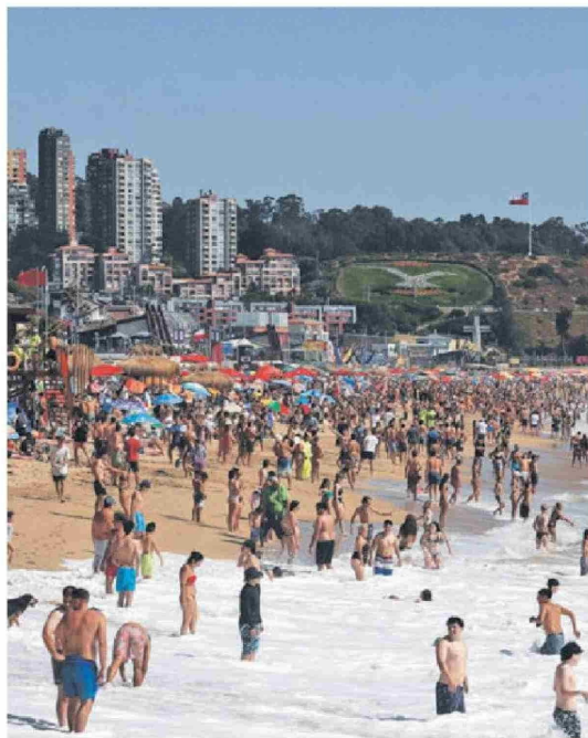
► Viña del Mar es la comuna con más visitantes.

Imágenes como esta son las que autoridades locales y del gobierno buscan evitar, y para lograr