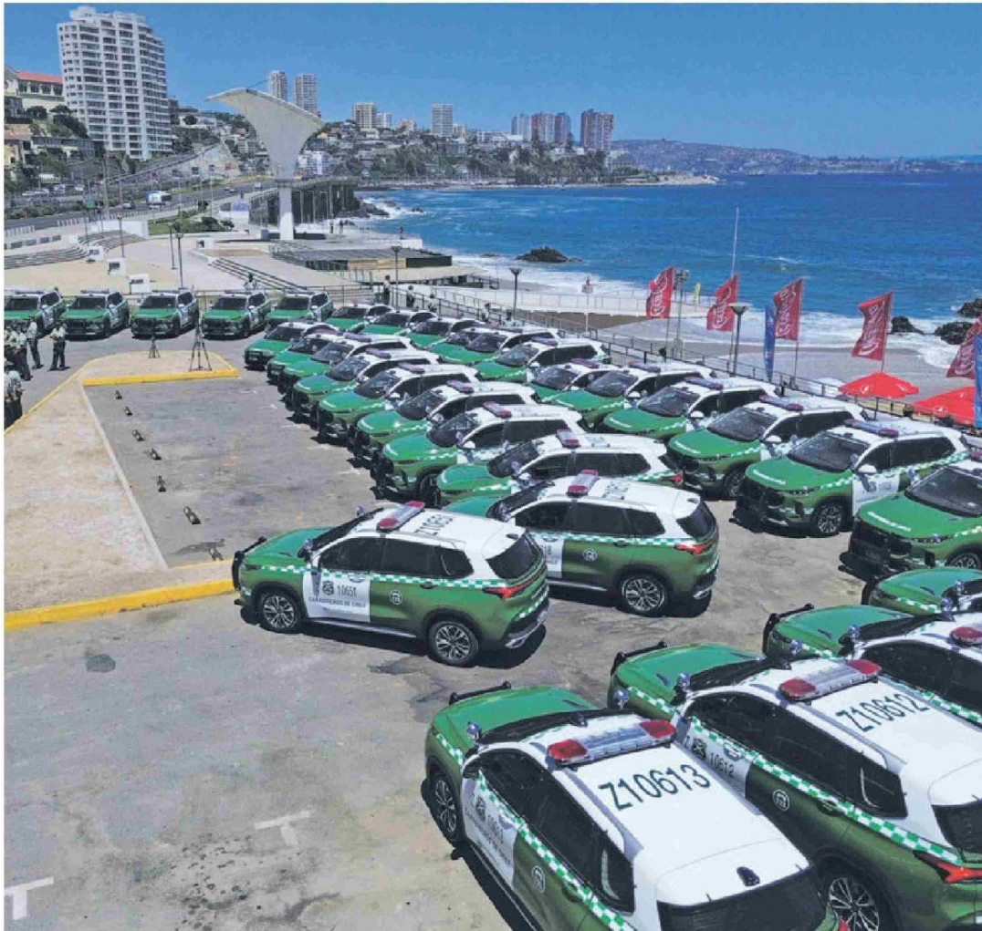
► La Región de Valparaíso tiene 60% más carabineros que el año pasado en el verano.

está en el decomiso del comercio ilegal de alcohol y alimentos. Además de emplear elementos tecnológicos para el resguardo de las playas nortinas.