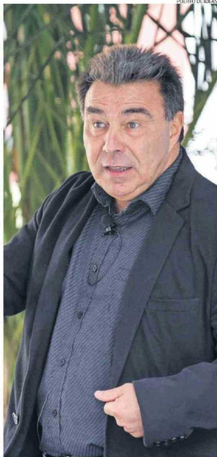
GOLES VISITA ANTOFAGASTA PARA PRESENTAR SU ÚLTIMO LIBRO.

- El tema que tomé para hacer mi doctorado estaba muy relacionado con los fundamentos lógicos de los algoritmos que posteriormente han posibilitado, por ejemplo, ChatGPT. Me he pasado parte importante de mi vida estudiando algoritmos y dinámicas relacionadas con ese tipo de objetos lógico-matemáticos.