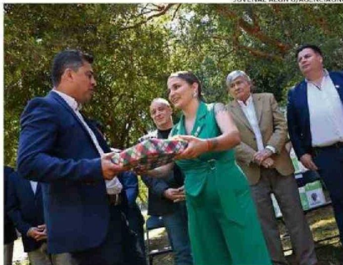
AUTORIDADES Y ORGANIZACIONES SALUDARON A ALCALDESA Y CONCEJO.

En la oportunidad fueron presentadas las siete categorías de Valdivia Destaca 2024. La co-