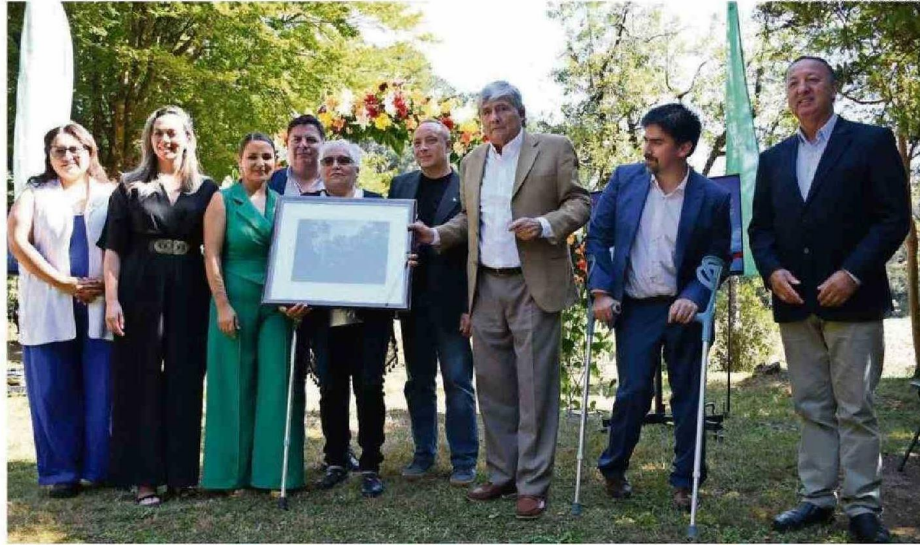
AYER FUERON ENTREGADOS RECONOCIMIENTOS A DISTINTAS PERSONAS QUE HAN APORTADO A LA COMUNIDAD.

Más adelante, la alcaldesa sostuvo que Valdivia no está ajena a la ocurrencia de emergencias e incendios, los que han afectado a vecinos y, en ese contexto, destacó que la comuna fue una de las primeras del país en contar con una dirección municipal de gestión de riesgos y de desastres, "con nuestros planes de emergencia aprobados y vigentes, con convenios de colaboración permanente con Bomberos para capacitar en prevención y actuar rápidos