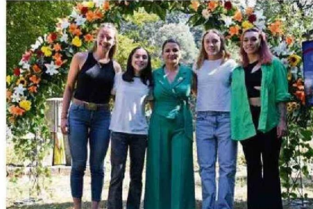
JÓVENES DEPORTISTAS POSTULAN EN CATEGORÍA DE VALDIVIA DESTACA.

En ese contexto, es que mencionó algunos elementos