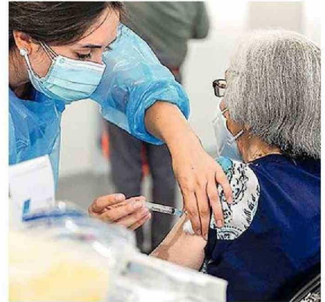
LA AUTORIDAD SANITARIA LLAMÓ A ADULTOS MAYORES A VACUNARSE.