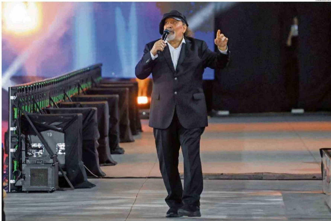
LA GALA DEL FESTIVAL DE VIÑA FUE LA ÚLTIMA APARICIÓN EN TELEVISIÓN DE MIGUEL PIÑERA LA SEMANA PASADA.

En palabras de él mismo, lo pasó "chanchito" en la Unidad Popular. A pesar de no ser alguien ligado a la política (tanto de izquierda como de derecha), las peñas y el movimiento cultural fueron muy importantes para él. Esto se acabaría con el golpe de Estado en 1973, con el cual disminuiría drásticamente la vida nocturna en el país, una a la