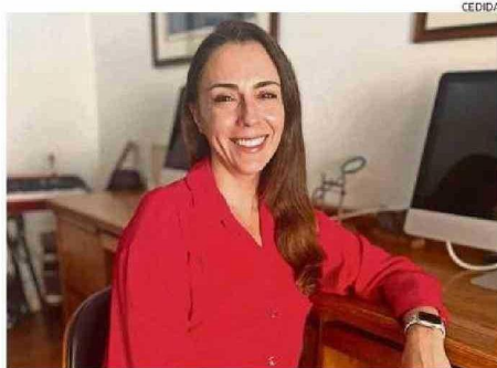
Churrua es una de las autoras y magíster en neurociencias.

En esa línea, la especialista plantea que "a diferencia de otros métodos como la saliva, la orina o la sangre, el análisis de uñas permite evaluar el estrés acumulado durante un período prolongado. Esto lo convierte en una herramienta más fiable para en-