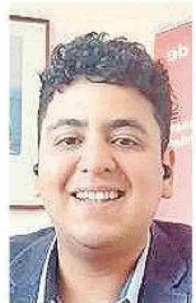
Seremi de Hacienda.