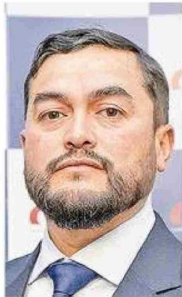
Presidente de la Cámara Chilena de la Construcción.