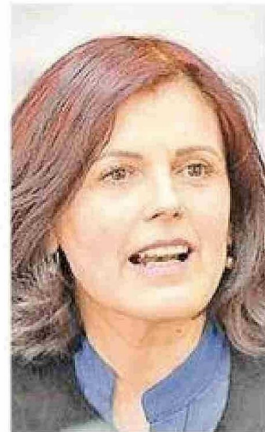
Seremi de Economía.