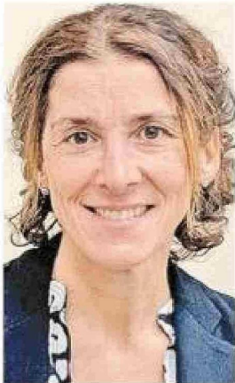
Presidenta Asociación de Salmonicultores.