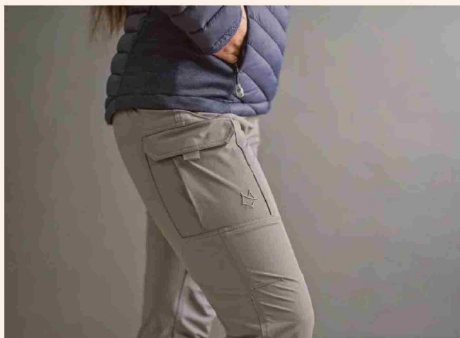
IZMOT ofrece comodidad y seguridad a toda prueba.