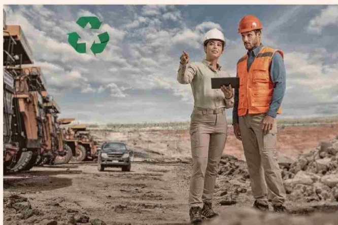
IZMOT ha sido diseñada para destacar en tres pilares fundamentales: calidad, experiencia de compra y servicio personalizado.