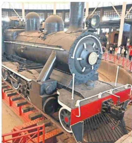
LAS LOCOMOTORAS SON EL GRAN TESORO DEL MUSEO FERROVIARIO.

gunda parada era el Pabellón Araucanía, la cual incluía una visita de 15 minutos para conocer el hito arquitectónico de madera que representara a Chile en la Expo Milán 2015 y