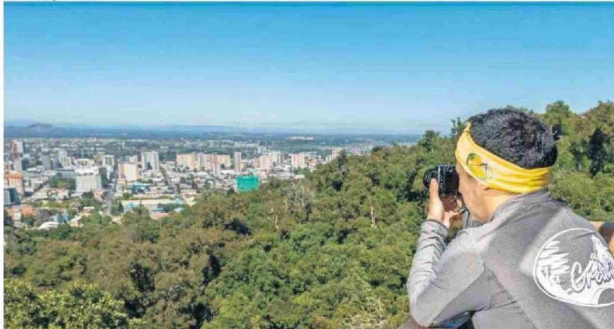
EL MONUMENTO NATURAL CERRO ÑIELOL OFRECE MIRADORES EN MEDIO DE LA VEGETACIÓN NATIVA DEL RECINTO.