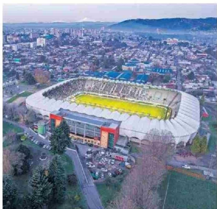
EL ESTADIO BICENTENARIO G. BECKER ES UNA PARADA DEL TOUR.