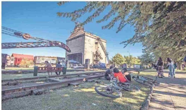
LA CARBONERA DEL MUSEO NACIONAL FERROVIARIO PABLO NERUDA ES UN ELEMENTO DISTINTIVO.

punto referencial para dueños de casa y visitantes, dentro de cuyo espacio se encuentra el Monumento a La Araucanía, obra inspirada en cinco personajes que fueron parte de la fundación de la ciudad. Esta plaza que alberga también una galería de arte, las oficinas de turismo y en uno de sus costados, al frente, se encuentra la Catedral, un edificio con historia que representa la principal “casa” de la Diócesis San José, institución de la Iglesia Católica que acaba de entrar en su año centenario.