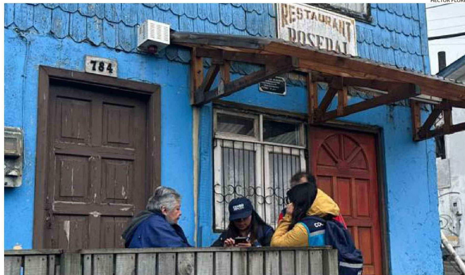
CASTRO ES UNA DE LAS COMUNAS DONDE EXTENDIÓ EL CENSO POR UN MES Y DONDE SE PROYECTA UN CRECIMIENTO POBLACIONAL.