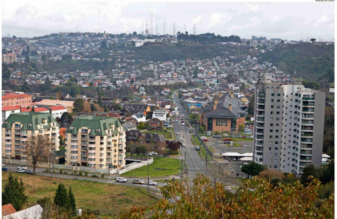
EL ALCALDE DE PUERTO MONTT, GERVOY PAREDES, PROYECTA QUE LA COMUNA LLEGARÁ A LOS 280 MIL HABITANTES EN ESTE CENSO.

Entonces, admite, “se observa el cambio en cuanto a la cantidad de personas que habitan el territorio. Pero no se tiene el dato duro. Por ello, el Censo entregará las certezas que nos permitirán ir adecuando las necesidades de cada territorio, de manera que el plan de inversiones sea ajustado en