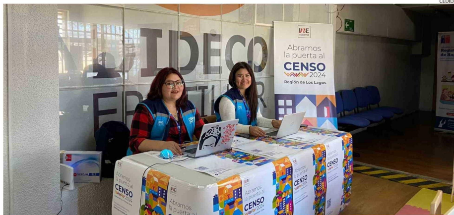
LA FASE EN TERRENO DEL CENSO EN 26 COMUNAS DE LA REGIÓN CONCLUYÓ ESTA SEMANA. AHORA LOS INTERESADOS PUEDEN ACERCARSE A PUNTOS HABILITADOS, PARA REALIZAR EL TRÁMITE SI ES QUE NO LO HAN EFECTUADO.