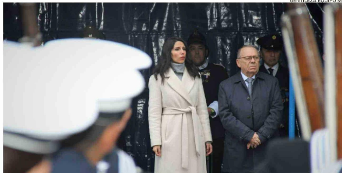
LA SENADORA GATICA Y LOS DIPUTADOS BERGER Y VON MÜHLENBROCK ENCABEZAN A LOS FIRMANTES DE CARTA.

Hace casi un año el subsecretario Manuel Monsalve anunció una serie de medidas de seguridad para la región tras descartar el Estado de Excepción constitucional, medidas que sólo quedaron en anuncios. Dentro de estas medidas se prometió la instalación de cámaras de seguridad en la entrada y salida de la ciudad, lo que sin du-