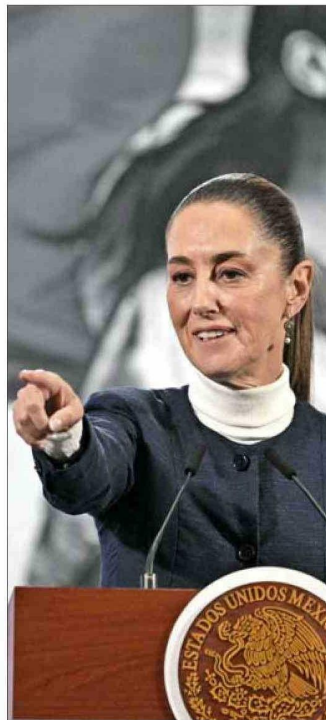
SHEINBAUM dijo que también crearán comisiones de trabajo con EE.UU.

Según Trump, los cárteles mexicanos, "principales traficantes mundiales de fentanilo, metan-