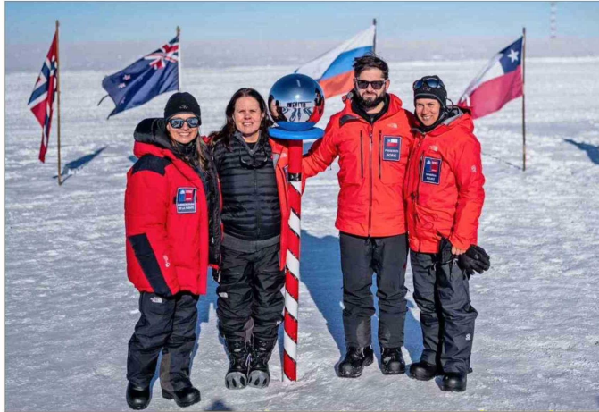
El Presidente Gabriel Boric, junto con la ministra de Defensa, Maya Fernández Allende, y del Medio Ambiente, Maisa Rojas, entre otros integrantes de la comitiva, que fue parte de la reciente visita al Polo Sur.

Ante la controversia, Boric afirmó que “si eso no está solucionado, no se puede hacer la compra, porque en Chile las ins-