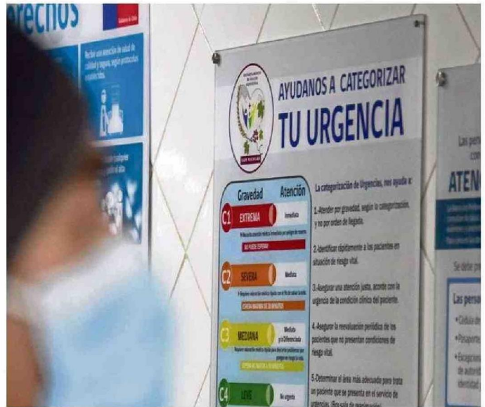
12 SON LOS ÑUBLENSINOS QUE HAN FALLECIDO A CAUSA DEL PYOGENES Y PNEUMONIAE.