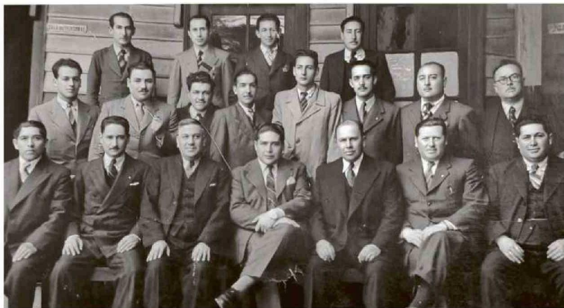
Dotación de la Comisaría Judicial de Investigaciones de Valdivia en la década de los 40.