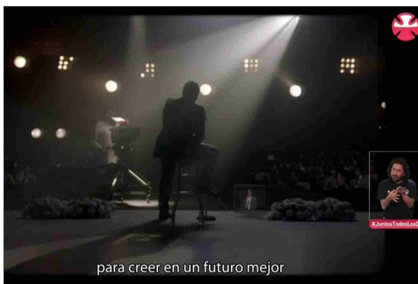
El escenario se adornó con flores, tal como fue en 1978.