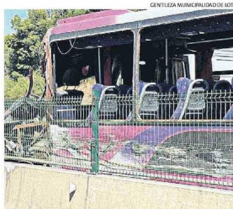
DIVERSOS EQUIPOS DE EMERGENCIA AUXILIARON A LOS HERIDOS.

“ Se puede afirmar con cierta certeza de que no se debieron a fallas mecánicas del vehículo, sino que a una conducción imprudente por parte del conductor”