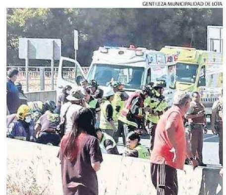
MÚLTIPLES EQUIPOS DE EMERGENCIA AUXILIARON A LOS HERIDOS.