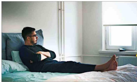
El 62% de los hogares unipersonales en Chile está compuesto por hombres, según los datos de 2022, el último año que abarca la medición.