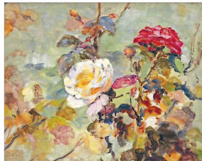
Las flores y rosas constituyen uno de sus géneros más celebrados.

Y Sánchez adelanta: "Para futuras muestras los coleccionistas están considerando seriamente entregar en comodato sus colecciones confiando en que vamos a cuidar y preservar esas obras. Hay una gran confianza en la universidad. Además, nosotros incorporamos a los donantes o comodantes en el trabajo que hace-