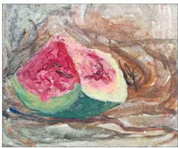
"Sandía", la última obra que pintó.

aleja al público. Nosotros queremos llegar a una audiencia amplia".