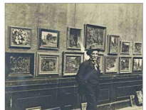
El artista en pleno montaje de una exposición, en Santiago, en 1916.

que ya hemos visto en otros ámbitos culturales y de arte. Hemos estado en contacto con familias y coleccionistas que tienen mucha pintura chilena para invitarlos a exhibir. Y también invitamos a que donen algunas obras a la universidad. Hay una enorme confianza en nosotros, la estamos viendo hoy para esta primera exposición. Hay numerosos coleccionistas que se han comprometido a donar una, dos o más obras".