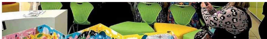
EN CALAMA, EL TALLER DE MEDIACIÓN LECTORA FUE REALIZADO EN EL COLEGIO GUADALUPE DE AYQUINA.

En las instancias se entregaron herramientas de mediación lectora a quienes están a cargo de los espacios dedicados a fomentar la lectura en las unidades educativas, "además de abordar temas primordiales como el Plan de Reactivación Educativa, la Política Nacional del Libro