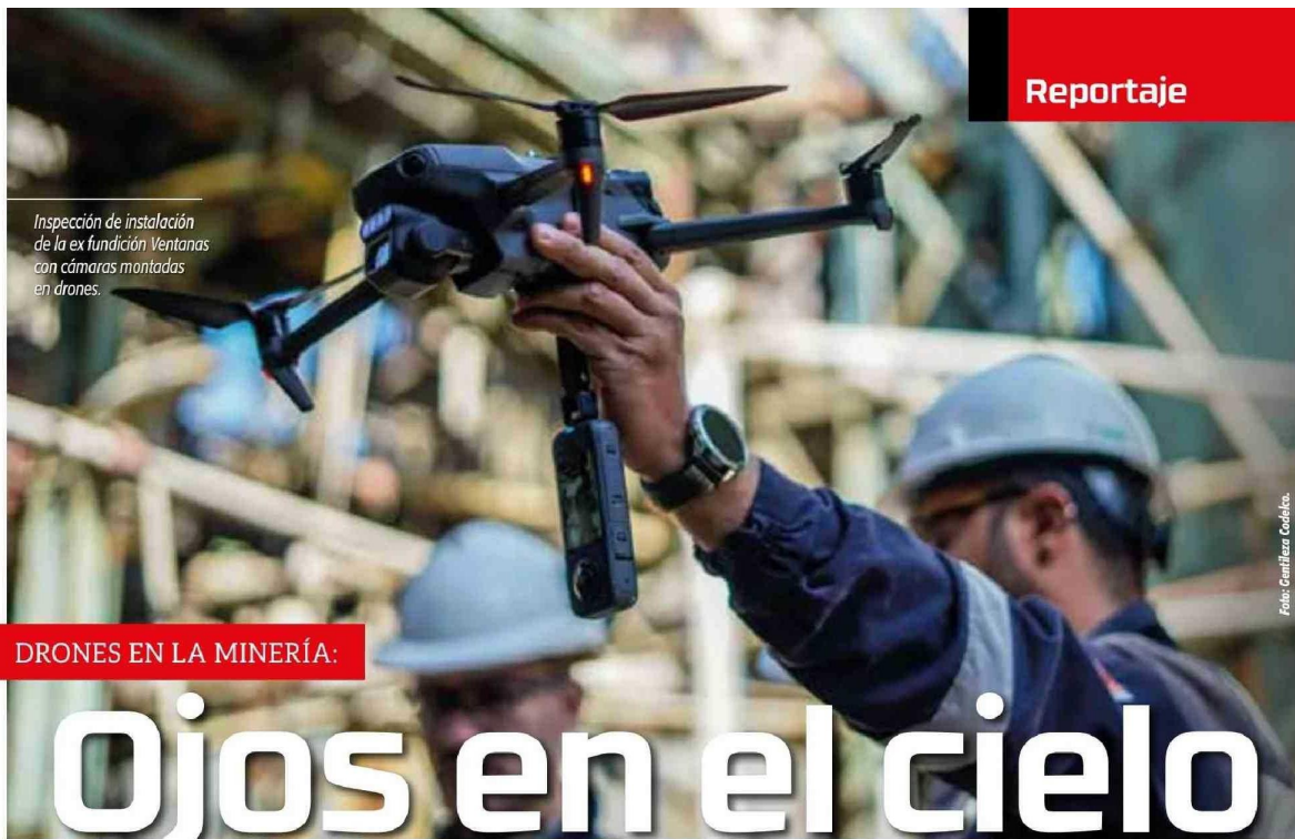
Inspección de instalación de la ex fundición Ventanas con cámaras montadas en drones.