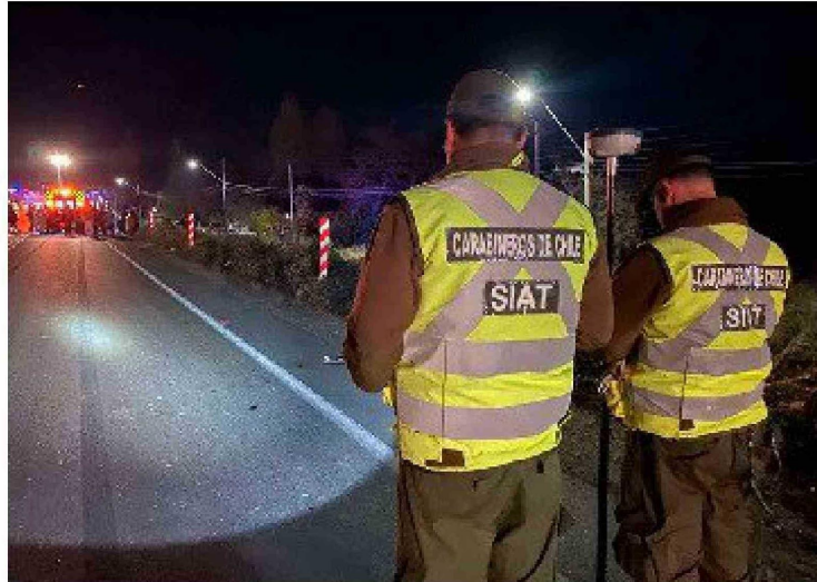
El cierre del período festivo fue trágico este domingo, con un accidente de tránsito en Quinta de Tilcoco, donde tres personas fallecieron y cuatro resultaron heridas.

jueves 19 de septiembre, personal de la PDI llegó hasta la Población 18 de septiembre de San Fernando, para investigar el homicidio de un hombre de 22 años que presentaba una herida en su tórax, lesión que habría provocado su muerte.