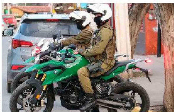
Carabineros de la región debió atender estos procedimientos ocurridos durante el fin de semana XL de Fiestas Patrias.