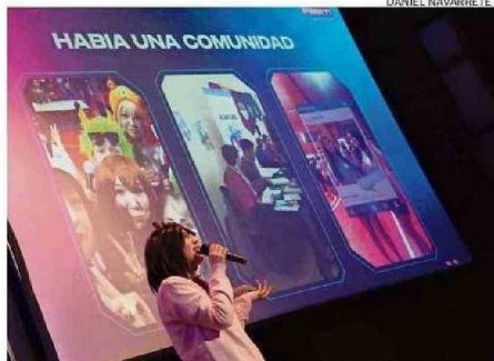
AYER POR LA MAÑANA FUE LA CHARLA SOBRE EL AKIBA FEST.

alguien cercano. Es algo asociado a la pérdida en general de cualquier cosa, incluso de un objeto preciado. El duelo es algo muy humano, es algo que nos conecta como personas”.