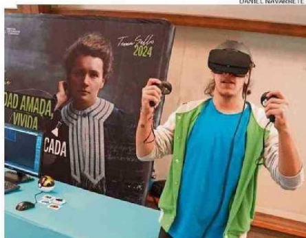
EL STAND DE LA CARRERA DE TÉCNICO EN DISEÑO DE VIDEOJUEGOS.