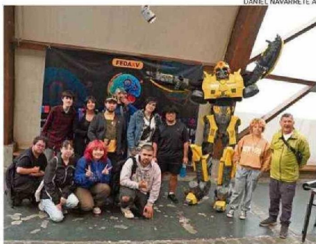
AL EVENTO ASISTIERON PRINCIPALMENTE ESTUDIANTES UNIVERSITARIOS.