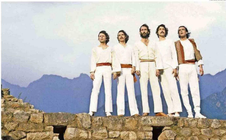
CANAL 13 MOSTRARÁ ESTA NOCHE "LOS JAIVAS, TODOS JUNTOS", UN HOMENAJE A LA BANDA VIÑAMARINA.