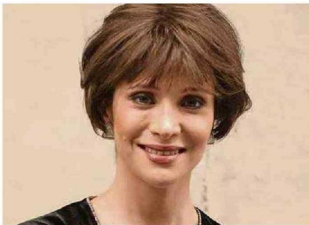
MEGA REESTRENARÁ LA MINISERIE "ISABEL".