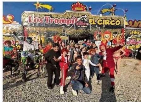
CHV PROMETE UN ESPECIAL DIECIOCHERO CON "SABINGO"

El horario prime de esta noche llegará con un especial de humor que se repetirá también este jueves 19. Pasadas las 0.30 horas, entre el 19 y el 20 de septiembre se emitirá "Héroes invisibles", una serie en coproducción entre Chile y Finlandia. ☺