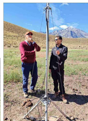
Para el monitoreo de aguas subterráneas se instalaron antenas de transmisión satelital como esta.