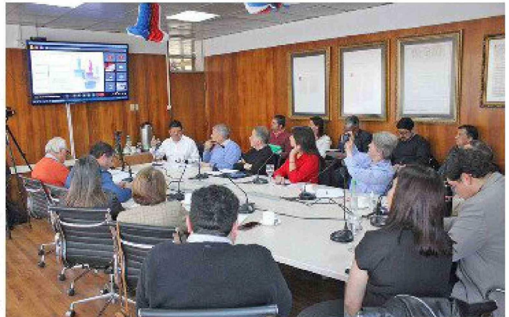
Sorprendidos y atónitos quedaron muchos sobre el informe final de la situación financiera de la CORMUN presentada en sesión extraordinaria del Concejo Municipal de Rancagua.

"Conmocionado" se mostró el senador por O'Higgins, Juan Luis Castro con lo ocurrido el pasado jueves en la sesión extraordinaria del Concejo Municipal de Rancagua, ya que alega que, a cinco meses de la administración suplente del municipio y a tres semanas de las elecciones, que se descubra hoy lo que la Contraloría General de la República dijo por escrito el 23 de diciembre del año 2022, es inaudito. "Estamos hablando de hace casi dos años atrás, cuando el ente auditor