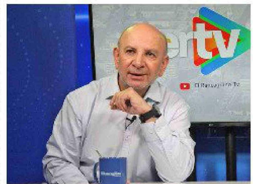
El senador Juan Luis Castro, dijo sentirse "conmocionado" por lo revelado en el informe final y la crisis financiera por la que atraviesa la CORMUN de Rancagua.

"Yo lo que trato de entender, y no puedo, es que, en un momento tan delicado, sobre todo cuando ya se está a punto de entregar