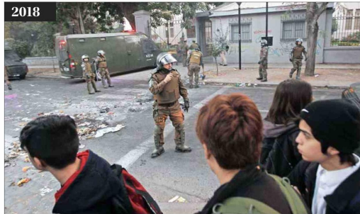
2018 El alcalde Felipe Alessandri también debió lidiar con la violencia en los liceos. En la imagen, Carabineros interviene durante protestas efectuadas en mayo de ese año.