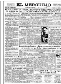
"El Mercurio" del 24 de agosto de 1939 informó del pacto.

"Para los socialistas, este pacto fue objeto de fuertes críticas porque el Partido Comu-