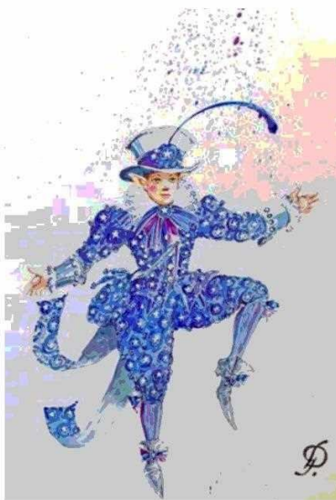
Sus figurines se caracterizaban por su expresividad y gran nivel de detalles; en todos aparece su firma.