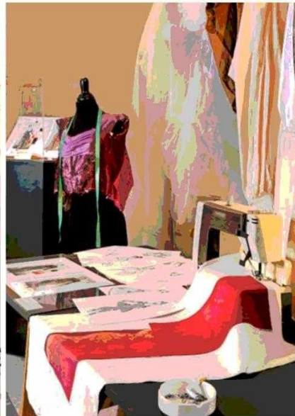
El montaje incluye una máquina de coser y un cenicero: era famoso por ser fumador.

rias de sus creaciones, guardadas por los artistas como referencia o recuerdo. "Descubrimos que en los talleres de escenografía existía un gran cariño y admiración por Germán Droghetti, con quien trabajaron en importantes óperas y ballets. Por eso quisimos a través de sus creaciones reconocer el trabajo de los escenógrafos, vestuaristas y cultores del teatro", explican las investigadoras.