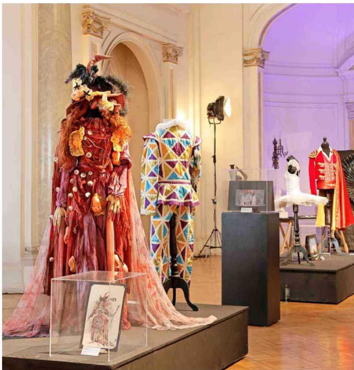
Figurín y vestuario de la bruja realizado para la ópera Hansel y Gretel .