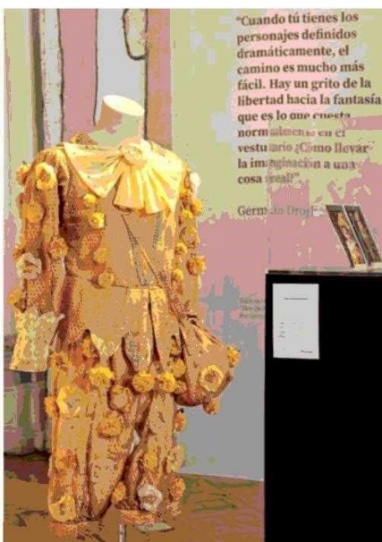
En el Taller de Vestuario y Caracterización encontraron el traje que diseñó para Taumanchen, de Hansel y Gretel .